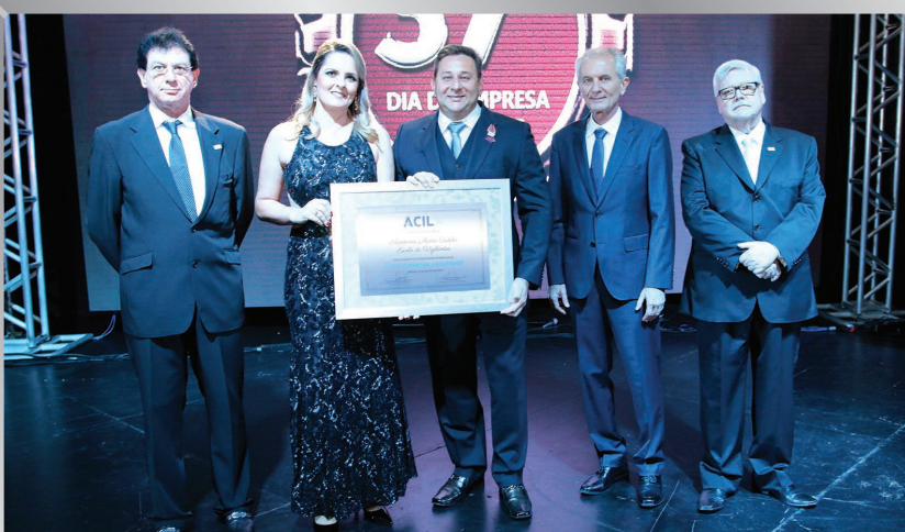
Academia Monte Castelo – Escola de Vigilantes | Serviços