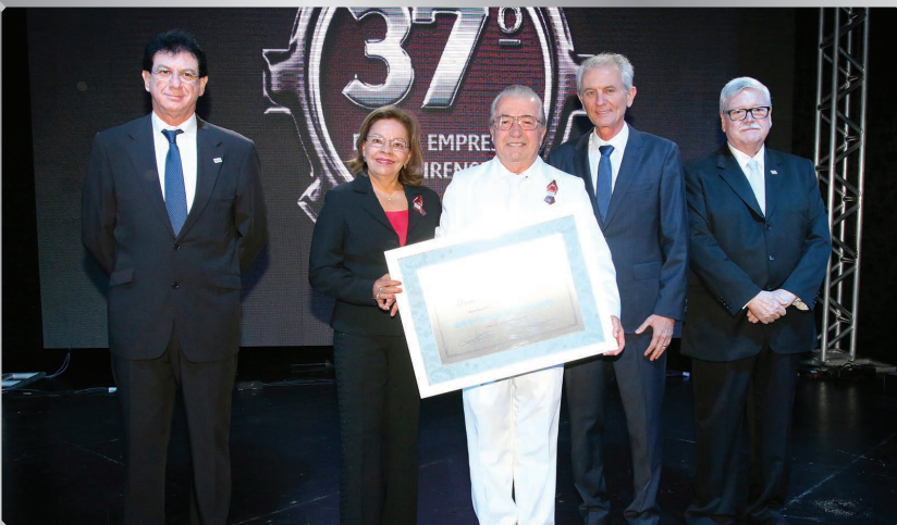
Santos Calçados & Fitness | Comércio