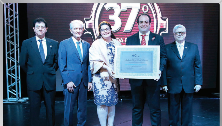
Carlton Plaza Hotel | Serviços