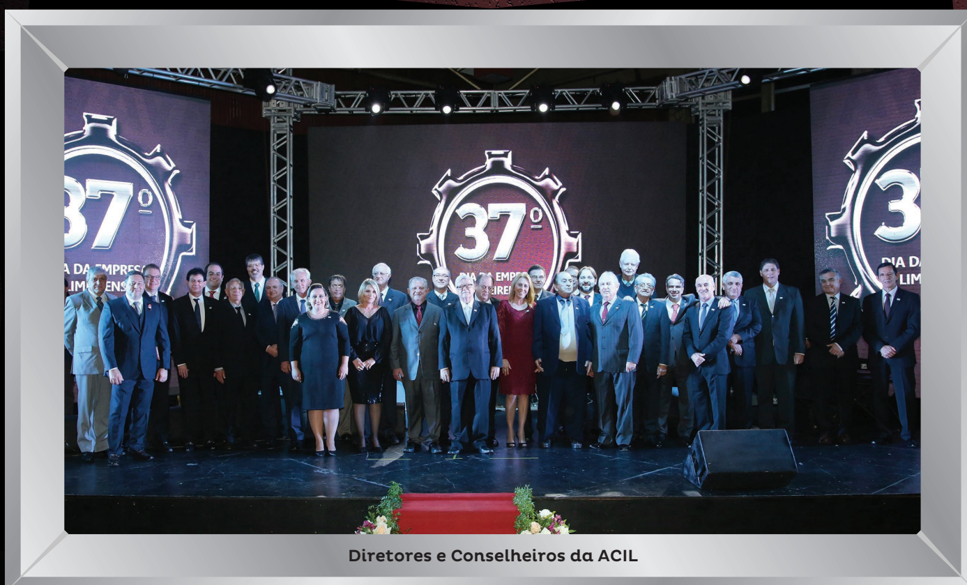
Diretores e Conselheiros da ACIL