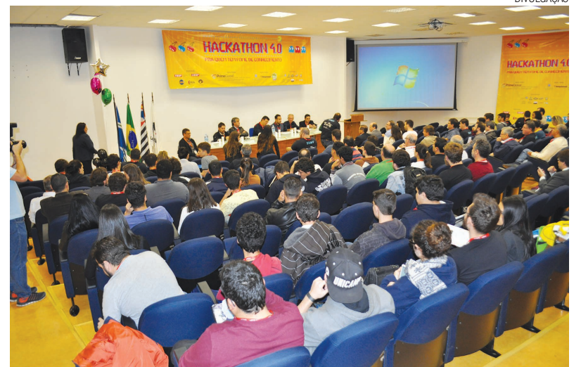
Cerca de 220 pessoas puderam conferir a maratona e a qualidade das soluções apresentadas na 7ª edição do Hackathon

Na categoria Indústria 4.0, a vencedora foi a ExpoLive 2.0, que reduz drasticamente o custo das empresas com feiras de exposição. Através da tecnologia de virtualização, o projeto consegue transportar o ambiente empresarial das feiras de negócios para dentro das empresas, com isso, reduz custos, aumenta a possibilidade de mais profissionais da mesma empresa visitar os estandes desejados além de criar um market place acessível 24 horas por dia, dentre outros ganhos com fo-