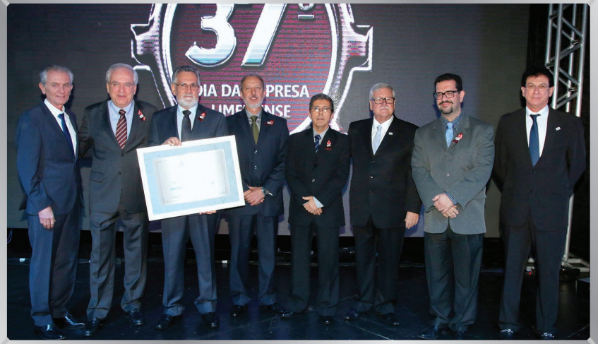
Unimed Limeira | Responsabilidade Social