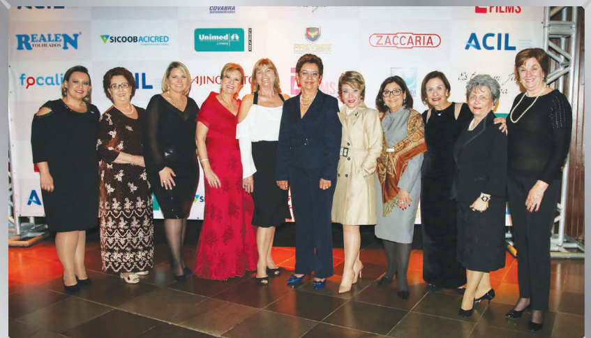
Conselho da Mulher Empreendedora