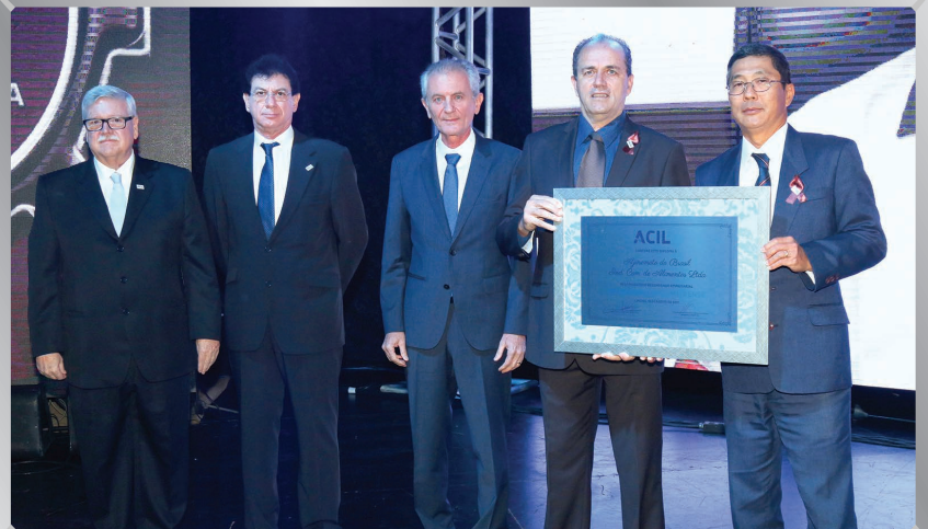
Ajinomoto do Brasil – Unidade Limeira | Indústria