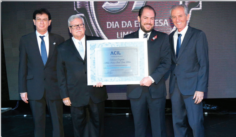
Calcário Cruzeiro | Indústria