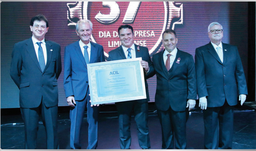
Bom Pastor – Convênios e Planos Assistenciais | Serviços