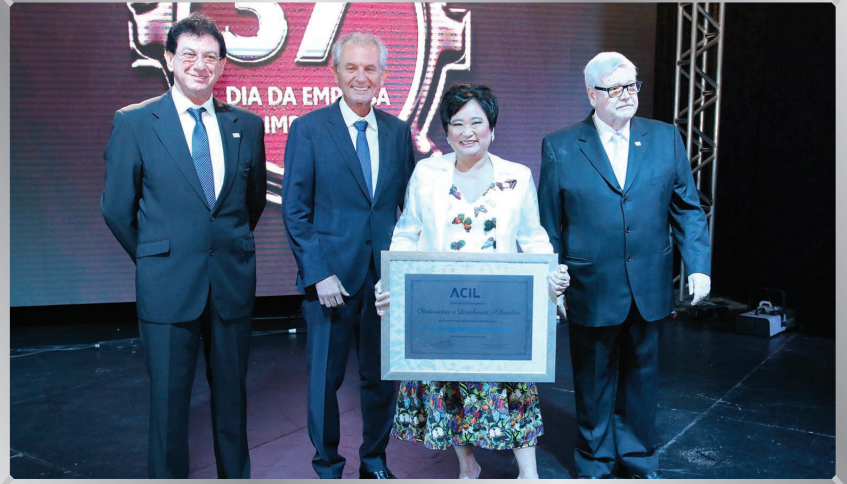
Restaurante e Lanchonete KiLanchão | Comércio