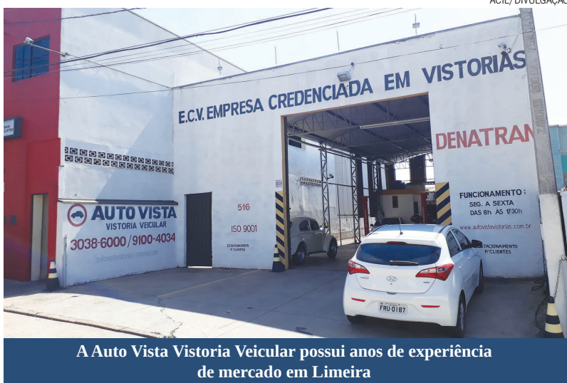
A Auto Vista Vistoria Veicular possui anos de experiência de mercado em Limeira

A Auto Vista Vistoria Veicular convida a todos para conferirem seu espaço e conhecerem a qualidade de seus serviços. A empresa está localizada na Rua Almirante Barroso, 516, no bairro Cidade Jardim. O horário de atendimento é de segunda a sexta-feira, das 8h às 17h30, e aos sábados das 8h às 12h. Para mais informações existem os números (19) 3038-6000 e (19) 99642-4500, o e-mail autovistavistorias@hotmail.com e o site www.autovistavistorias.com.br .