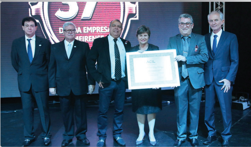
Escola SENAI “Luiz Varga” | Instituição