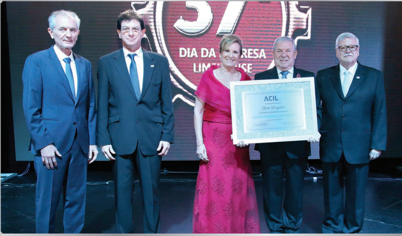
Rede Drogalim | Comércio