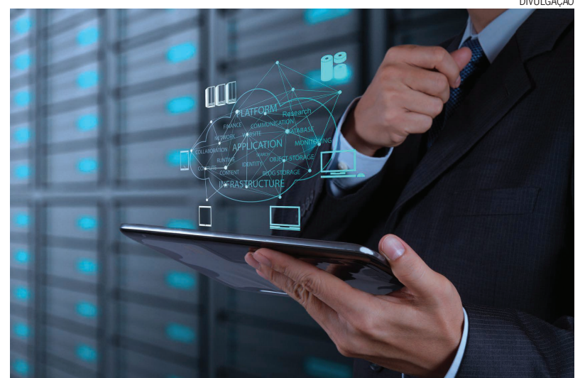
Um software personalizado permite agregar detalhes específicos, adaptando o sistema ao modelo de negócio

Outra ferramenta que surgiu para auxiliar o empreendedor em seu dia a dia, são os servidores em “nuvem”. “Com a maior disponibilidade de links de internet, tornou-se possível a fácil utilização deste tipo de servidor. Assim como os servidores alocados dentro da própria empresa, os de ‘nuvem’ proporcionam melhor acessibilidade ao sistema de qualquer lugar que haja um computador ou dispo-