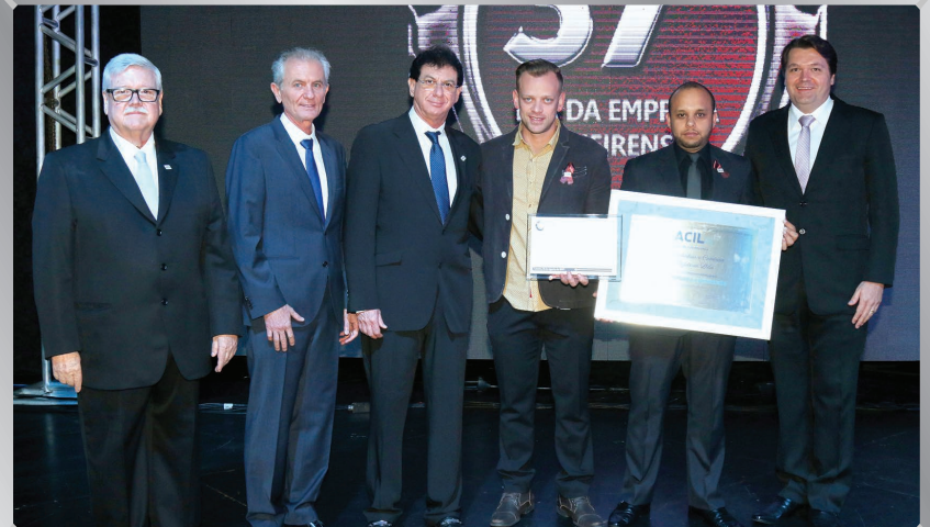
RQL Folheados | Indústria