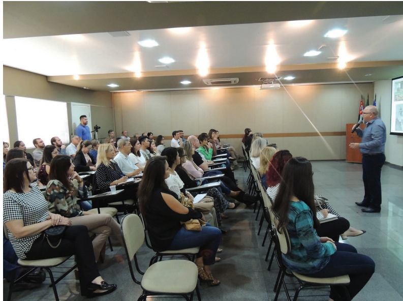
Sucesso resume a última edição do Café da Manhã do Conhecimento

Na ocasião o comunicador apresentou a palestra “Sua empresa tem um desafio, a Comunicação tem a solução” e falou sobre como a comunicação é essencial para a empresa, as ferramentas que podem ser utilizadas e a importância da assessoria especializada para que os objetivos sejam alcançados. “O tema é fundamental para a classe empresarial, principalmente no