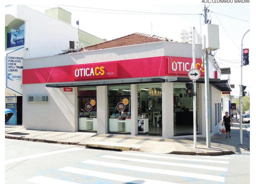
A Ótica CS Crislen tornou-se referência no mercado de serviços óticos, graças a qualidade de seus produtos e atendimento

Existem diversos modelos de óculos, sejam eles de grau ou de sol. Todos os anos são lançadas novas coleções de grandes marcas e de vários valores para agradar o consumidor, ajudando assim a trazer mais personalidade e estilo para este acessório. E assim como o produto, as lojas também se reinventam para atrair e fidelizar seus clientes.