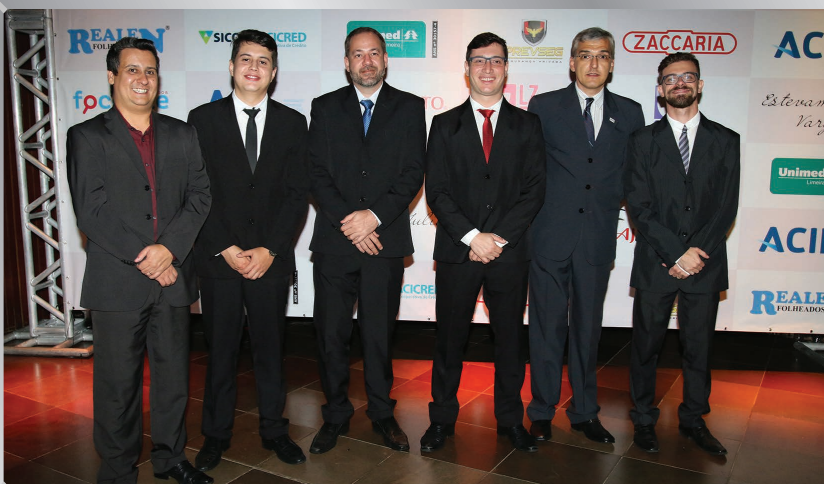
Núcleo de Jovens Empreendedores